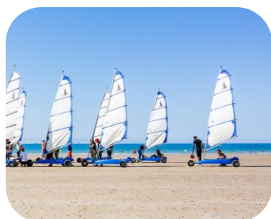
Char à voile