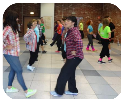
Danse en ligne

Ouvert à tous (Dirigeants, animateurs, licenciés).