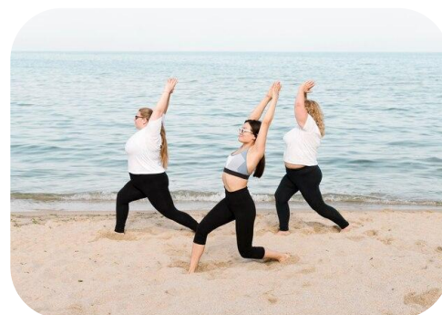
Réveil musculaire, stretching